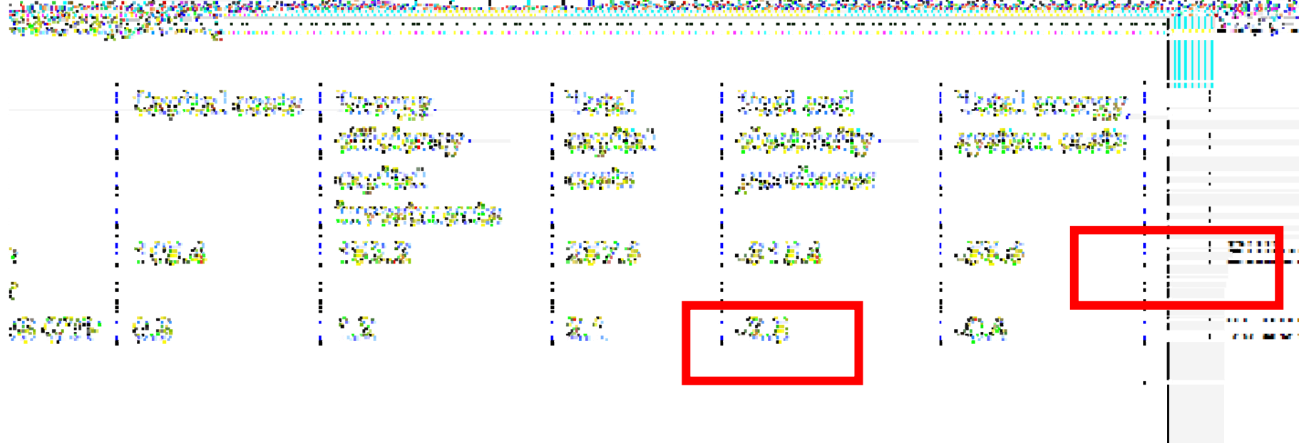
Annual incremental investments to decarbonize EU economy by 2050