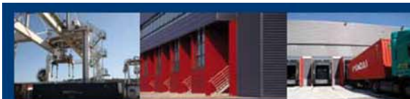
PLATE-FORME MULTIMODALE ET LOGISTIQUE DOURGES