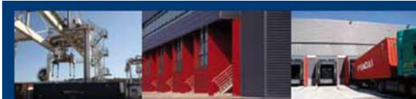
PLATE-FORME MULTIMODALE ET LOGISTIQUE DOURGES