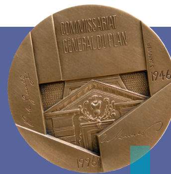
Cinquante ans de planification à la française, médaille commémorative réalisée en 1996.

Interministériel par essence, le Centre d'analyse stratégique éclaire le Gouvernement dans la définition et la mise en œuvre de ses orientations stratégiques et préfigure les principales réformes gouvernementales en matière économique, sociale, environnementale ou technologique.