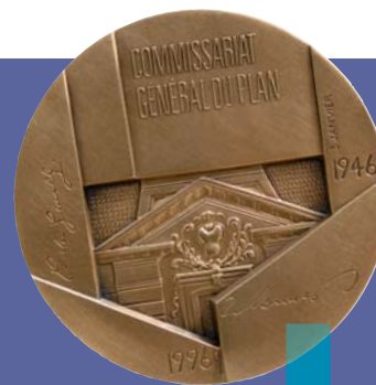
Cinquante ans de planification à la française, médaille commémorative réalisée en 1996.

L'Hôtel de Vogüé, Siège du Centre d'analyse stratégique